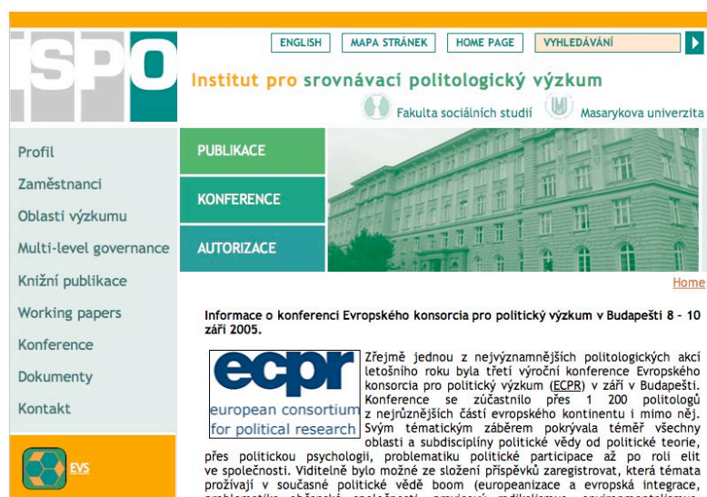
Obr. 2. Náhled webových stránek ISPO

Součástí prezentace činnosti a výsledků badatelské snahy ISPO je provozování internetových stránek www.ispo.fss.muni.cz . Zde jsou zveřejňovány mj. konferenční příspěvky členů ISPO, oznámení o nových publikacích a dalších aktualitách, které mají vztah k činnosti ISPO.