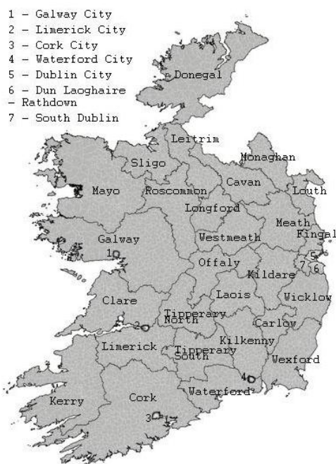
Obrázek 1: Územní členění Irské republiky dle prvního stupně samosprávy – rad hrabství

( http://www.environ.ie/en/ , vlastní zobrazení dle